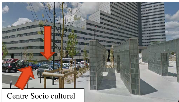
Centre Socio culturel Du Sillon de Bretagne

Coordonnées GPS : 47° 14' 37.969" Nord et 1° 36' 24.569" Ouest.