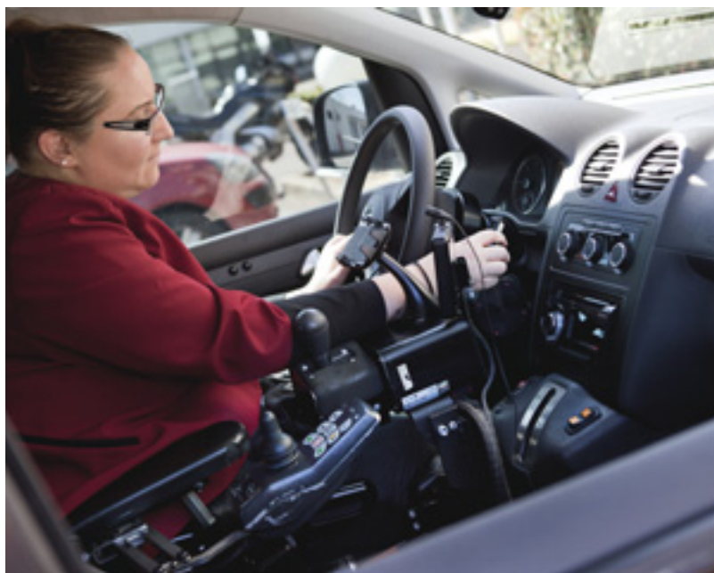
Le permis doit être régularisé sur la voiture équipée des nouveaux aménagements.